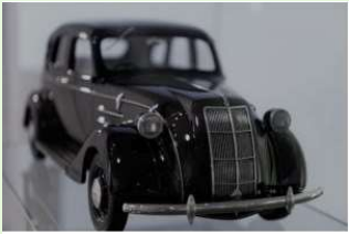
La première voiture sortie de l'usine de Toyota: la Sedan AA

Toyota est classé en 2019 le deuxième plus grand constructeur automobile mondial